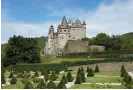
GDKE, U. Pfeiffer

Uniek bewijs van de Rijnlandse adellijke cultuur