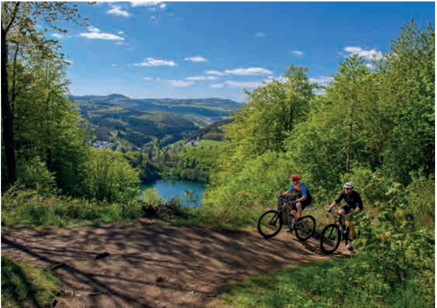
Uitzicht op de Gemündener Maar met het Pützbachtal

Hartelijk welkom in de Vulkaneifel, het land van de meren en vulkanen. Uitgestrekte hoogten, dichte bossen, heldere beekjes, geurige weiden en mooie dorpjes – de Vulkaneifel presenteert zich als een prachtige vakantieregio, die niet vrediger zou kunnen zijn. Onder het oppervlak heerst echter niet alleen stilte. De enorme vulkanische krachten die ooit hebben geleid tot het ontstaan van dit betoverende, deels ook ruige landschap, zijn nog steeds actief.