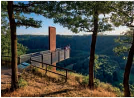
Uitzicht op de Eifel vanaf de Achterhöhe, Lutzerath

ming en duurzame ontwikkeling, zowel voor de bevolking van de regio als voor bezoekers. Bovendien dienen ze als identificatieanker voor het regionale bewustzijn. Onderwerpen als klimaatverandering, natuurverschijnselen of het duurzame gebruik van hulpbronnen worden belicht. Het natuurpark Vulkaneifel heeft een unieke natuurlijke kwaliteit door de combinatie van meren, vulkanen en afwisselende cultuurlandschappen. Dit zijn uitstekende voorwaarden voor een duurzame ontwikkeling in combinatie met een natuurvriendelijk landgebruik, regionale toegevoegde waarde, natuurtoerisme en economische ontwikkeling.