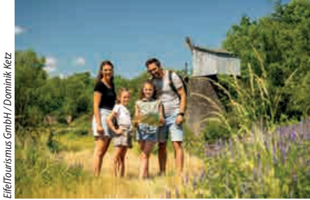
EifelTourismus GmbH / Dominik Ketz

Een spannend avontuur voor het hele gezin. Ontdek en beleef 7000 jaar mijnbouwgeschiedenis