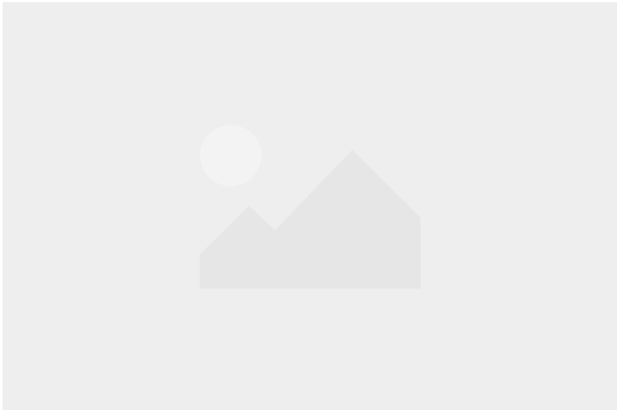
Kurpark Daun